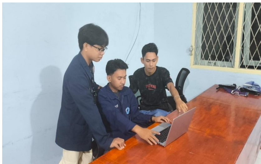
Gambar 2. Pelaksanaan Pembaruan Profil Desa

Setelah dilakukan proses edukasi terkait pentingnya website sebagai media informasi publik serta proses pengerjaan website. Proses pengabdian ini melakukan pelaksanaan pembaruan profil desa. Proses pelaksanaan dapat dilihat pada gambar di bawah ini.