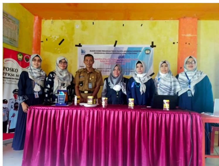
Gambar 1: Persiapan sebelum materi

Hasil lain yang dicapai adalah terbentuknya kelompok usaha kecil di Desa Timbuseng yang difasilitasi perangkat desa. Kelompok ini berfungsi sebagai wadah kolaborasi antar pelaku UMKM sekaligus menjadi embrio pembentukan koperasi desa yang dapat menjadi sarana permodalan berbasis komunitas. Melalui monitoring dan evaluasi, diketahui bahwa mayoritas peserta merasa kegiatan bermanfaat karena meningkatkan pemahaman, keterampilan, serta kesiapan mereka dalam mengakses permodalan. Secara keseluruhan, kegiatan ini memberikan dampak positif terhadap peningkatan kapasitas UMKM di Desa Timbuseng, baik dari aspek pengetahuan maupun kelembagaan.