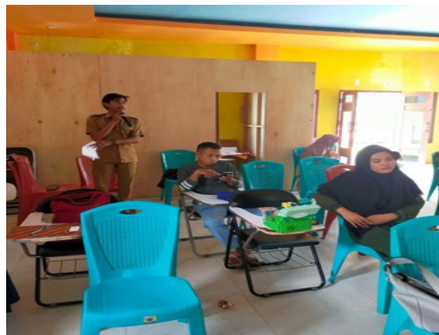
Gambar 3: Pertanyaan peserta kegiatan

Kegiatan pengabdian yang dilaksanakan dengan pendekatan partisipatif terbukti mampu meningkatkan efektivitas program karena masyarakat dilibatkan sejak tahap perencanaan hingga evaluasi. Hasil kegiatan menunjukkan bahwa pelaku UMKM di Desa Timbuseng lebih mudah menerima materi dan termotivasi untuk berpartisipasi aktif ketika mereka dilibatkan dalam identifikasi masalah dan perumusan solusi. Hal ini sejalan dengan penelitian (As' ari et al., 2025) yang menegaskan bahwa pendekatan partisipatif dapat meningkatkan rasa memiliki dan mendorong keberlanjutan program pemberdayaan masyarakat.