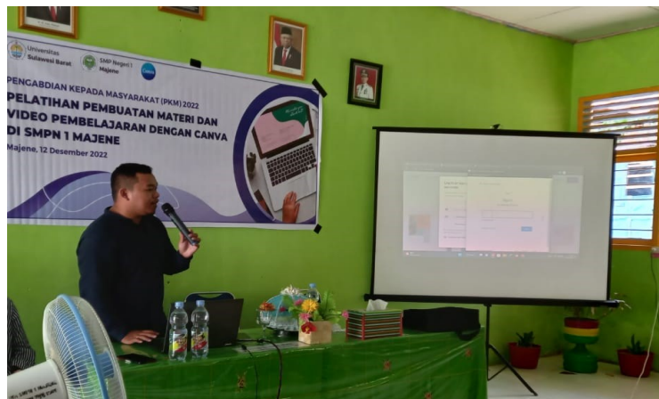
Gambar 1. Pemaparan materi pelatihan

Kegiatan pelatihan dilaksanakan pada tanggal 12-13 Desember 2022 dan dilaksanakan secara offline. Pelatihan ini diawali dengan pembukaan yang dihadiri oleh Tim pengabdian dan seluruh peserta pelatihan dari SMPN 1 Majene. Setelah acara pembukaan dilaksanakan, dilanjutkan pemaparan materi yaitu penjelasan tentang pembuatan materi pembelajaran menggunakan aplikasi Canva .