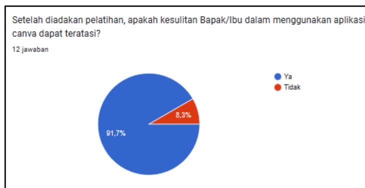
Gambar 4. Respon peserta setelah pelatihan

Berdasarkan Gambar 4, setelah pelatihan, persentase meningkat menjadi 91.7% peserta yang merasa kesulitannya dalam menggunakan aplikasi Canva dapat teratasi. Para peserta pelatihan juga menambahkan bahwa pemahaman dan wawasan mereka bertambah seiring berjalannya kegiatan mulai dari awal sampai akhir. Bahkan, beberapa guru menyarankan adanya tambahan rangkaian kegiatan lain seperti bantuan dalam pembuatan akun Canva Education .