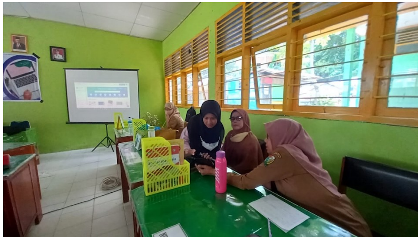
Gambar 2. Pendampingan peserta pelatihan

ke Canva, pengenalan toolbar Canva, cara memilih template sesuai kebutuhan, serta cara mendesain template berupa penambahan elemen, teks, audio dan lain-lain. Setelah materi selesai, dilanjutkan dengan pemberian kuisisioner post-test untuk melihat perbedaan sebelum dan sesudah diadakan pelatihan.